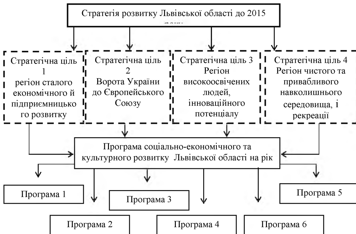
Рис. 2. Засоби реалізації Стратегії розвитку Львівської області до 2015 року

Серед галузевих програм можемо виділити : Програму інвестиційного розвитку Львівської області на 2011-2015 роки, рішення облради від 17.05.2011 р. № 126; Регіональну програму з міжнародного і транскордонного співробітництва, європейської інтеграції на 2012 - 2014 роки, рішення обласної ради від 16.03.2012 р. № 403; Програму енергозбереження для населення Львівщини на 2013 - 2016 роки, рішення облради від 19.02.2013 № 680; Програму розвитку освіти Львівщини на 2013-2016 роки, рішення обласної ради від 26.04.2013 № 726; Програму та напрями використання коштів в галузі сільського та лісового господарства Львівщини на 2013 - 2015 роки, рішення обласної ради від 16.05.2013 № 760 та інші [14], див. рис. 3.